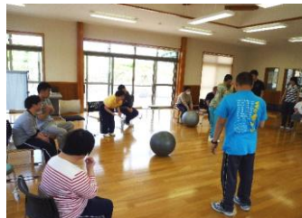
ボール運動の様子

指定障害福祉サービス事業の生活介護事業において、常時介護を要する利用者様に対して、自立した日常生活又は社会生活を営むことができるよう、排泄、食事等の介助、創作的活動又は軽作業等の生産活動上の機会を提供、その他の便宜を適切かつ有効に行うことを目的としています。