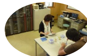
ワークサンプルを使用したピッキング風景