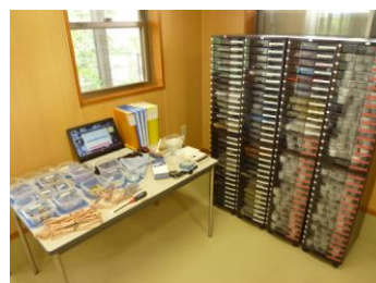
ワークサンプル幕張版