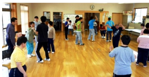
レクダンスの様子